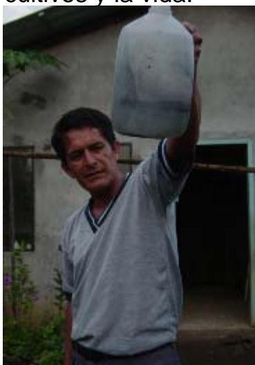
(campesino con muestra de agua lluvia contaminada)

La empresa petrolera italiana que opera en la provincia de Pastaza dice que trabaja con los más altos estándares de calidad ambiental; parece que estos estándares son tan altos que llegan hasta el cielo y allí se convierten en lluvias de hollín que caen sobre poblaciones indígenas y campesinas contaminando el agua, los cultivos y la vida.