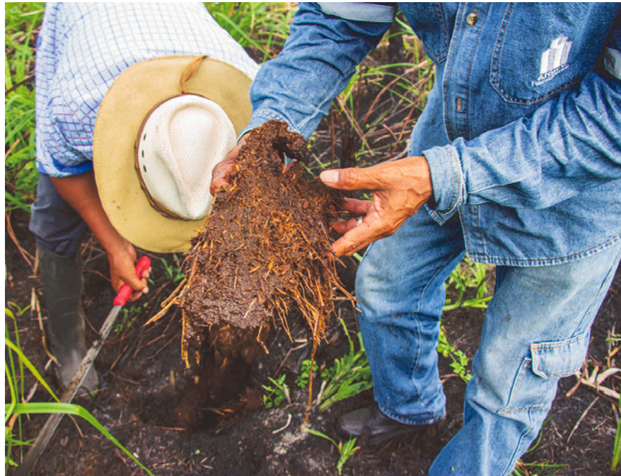
Momento en que encuentran la humedad en el subsuelo que les indica que corre agua debajo. Humedal Las Garzas, Los Ríos, Ecuador.

Lo más tremendo es que no tenemos que culpabilizar a toda la gente que habitamos el mundo. Quienes predan, acaparan, devastan, contaminan, agotan, desperdician y lucran con nuestra agua tienen nombres y apellidos. Y tenemos que defender con nuestros propios modos ese nuestro ámbito de comunidad, el agua, ese tejido de relaciones que hace posible la vida en su ciclo perpetuo que seguirá infinito mientras nosotros lo cuidemos y lo defendamos de la voracidad de las empresas. 🌿