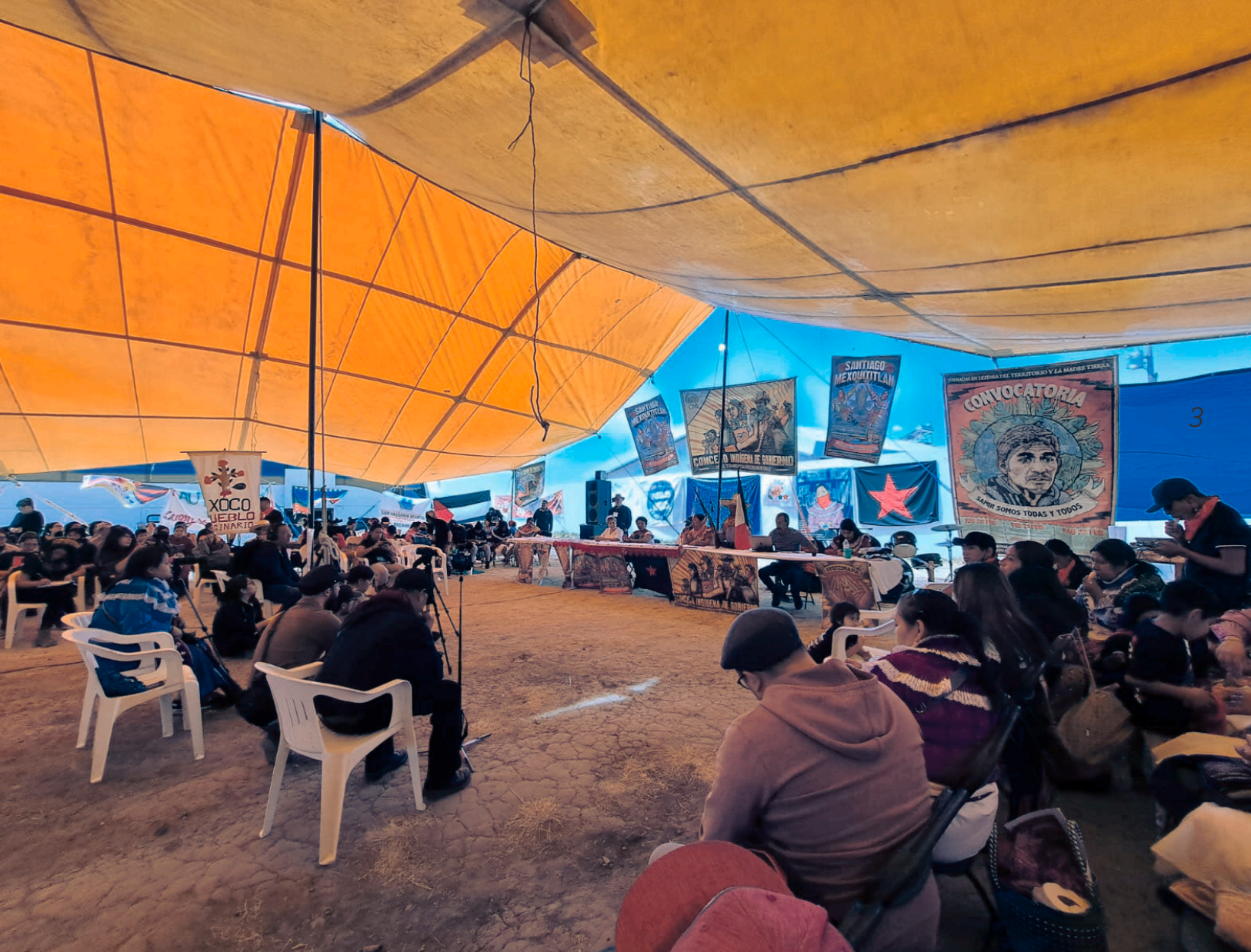
Asambleas por el Agua y la Vida.

subsecuente toma y fundación del Altepemelcalli , "La Casa de los Pueblos", en respuesta a la creciente escasez del agua, la merma del líquido vital de los pozos artesanales y la alteración del sistema de cosecha del agua en la región. Tal ocupación se mantuvo hasta que el 15 de febrero de 2022 fueran recuperadas las instalaciones por la Guardia Nacional en salvaguarda de la propiedad privada de la empresa. 4