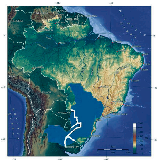
Acuífero Guarani.

Una preocupación es el Acuífero Guarani. Con una extensión de 1,2 millones de km 2 , (equivalente a la suma de los territorios de Italia, Francia y España), este acuífero es compartido por Brasil (70%), Argentina (19%), Uruguay (6%) y Paraguay (5%), y tiene sus principales zonas de recarga en áreas dominadas por la agroindustria. 5 En este sentido, es posible afirmar que esta reserva hídrica está amenazada no sólo por el agotamiento debido a la extracción, que ya hace inviable el acceso a través de pozos poco profundos, sino principalmente por la contaminación por el uso desenfrenado de fertilizantes y agrotóxicos, 6 y por los residuos de cría concentrada de cerdos y aves 7 en los estados del Sur de Brasil. Su sobreexplotación en sistemas de captación de pozos profundos, en particular para el riego de monocultivos, ya reduce significativamente su capacidad para satisfacer las necesidades del consumo humano, con pozos de agua poco profundos cada vez más inviables debido a la bajada del nivel del agua. En 2009, evaluaciones realizadas en la región de Ribeirão Preto (São Paulo) identificaron que la tasa de retirada superaba en 30 veces el volumen de recarga. 8