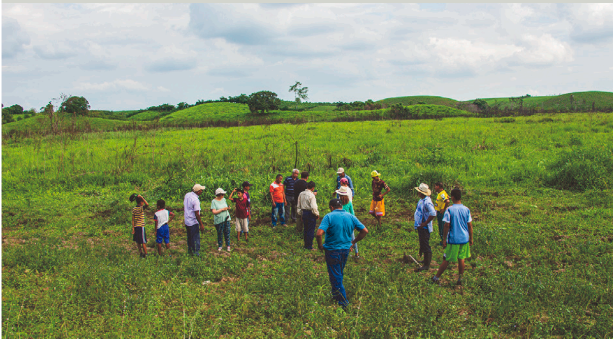
Las comunidades de Los Ríos defienden el Humedal Las Garzas.