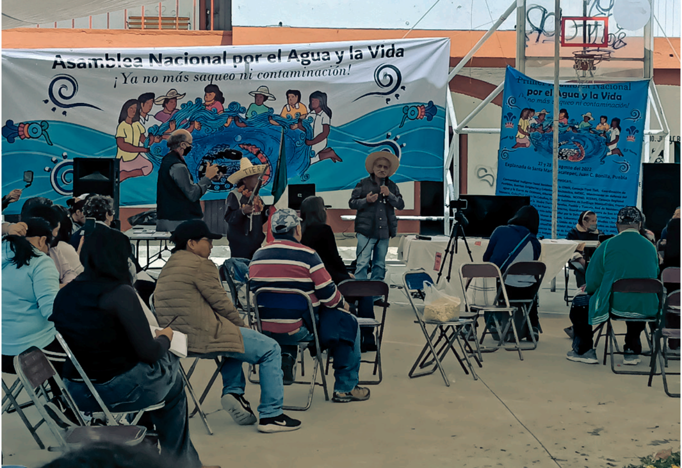
Asamblea por el Agua y la Vida.

continúa bajo la figura de la Asamblea Nacional del Agua y por la Vida como un movimiento de alcance nacional vinculado con colectivos y organizaciones de otros países.