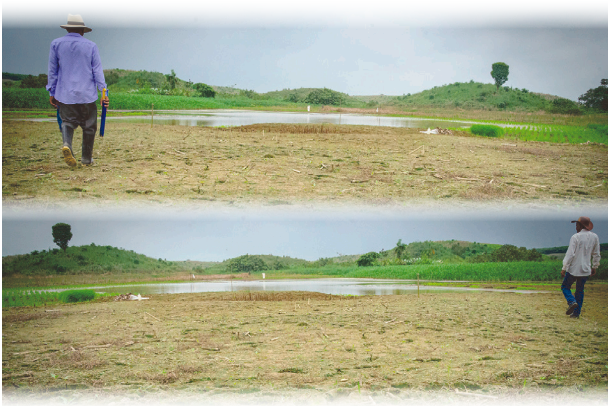
Humedal Las Garzas, Los Ríos, Ecuador.