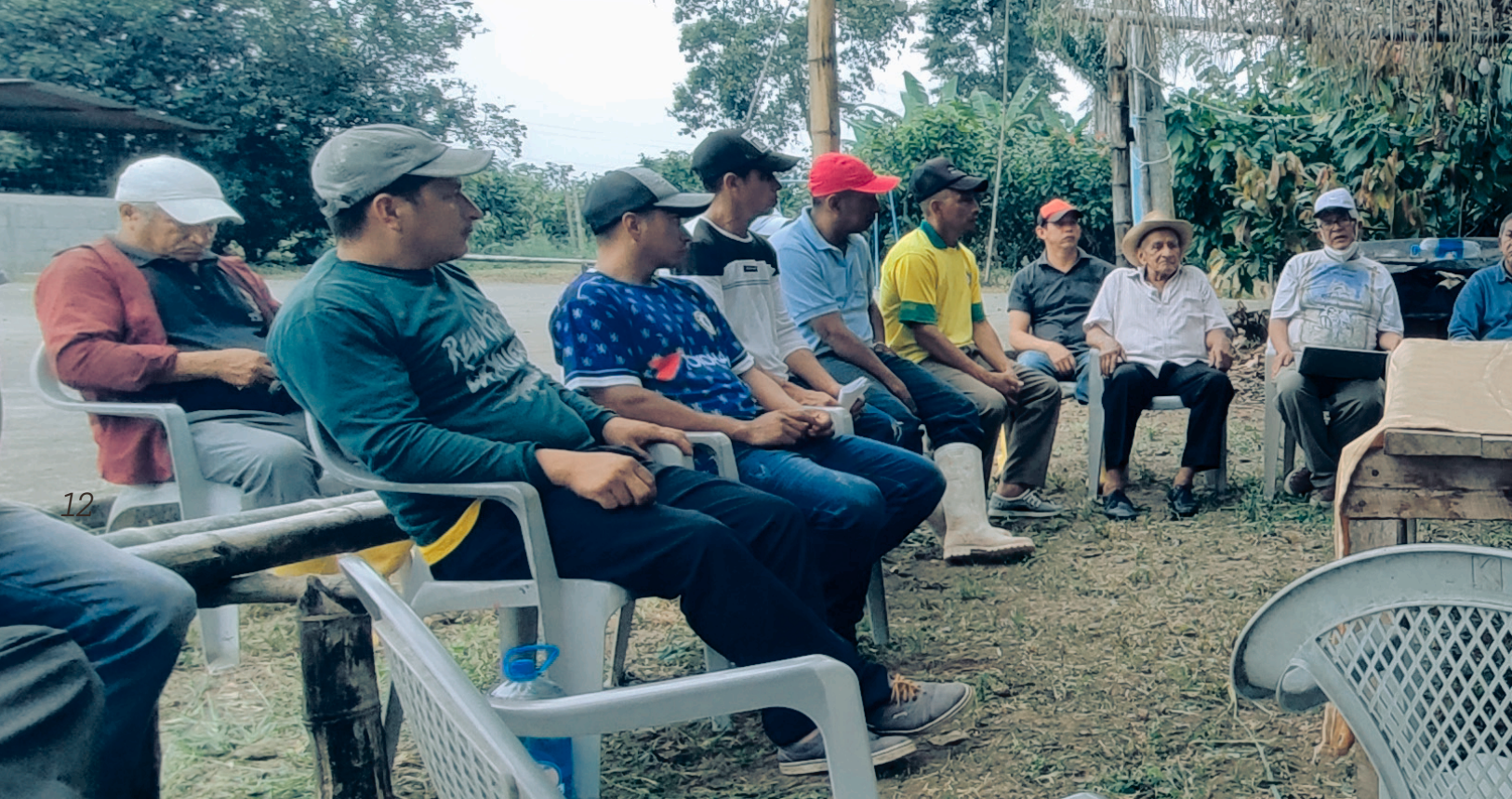
Comunidades organizadas en asamblea para enfrentar a la bananera que pretende apoderarse del Humedal Las Garzas, Los Ríos, Ecuador.

rales y progresistas, ya sea desmantelando el Estado para facilitar la ocupación parasitaria de territorios y bienes públicos, o fortaleciendo la institucionalidad del Estado para imponer por la fuerza en los territorios, la presencia de megaobras y corporaciones extractivas transnacionales. También se sabotó la institucionalidad para favorecer la penetración delincuencia en todos sus ámbitos. Y se ejercieron sus gobiernos bajo estados de excepción permanentes. (De los 18 meses de gobierno de Lasso, 13 fueron bajo estados de excepción.)