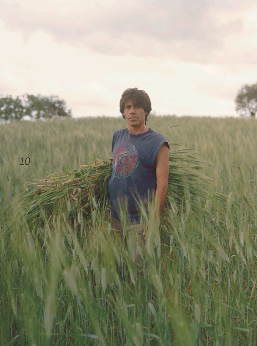
Al cuidado del ancestral trigo "Recio de la Ronda", en la Sierra de las Nieves, Andalucía, Estado español.

La Carta enviada también llama la atención de los Relatores Especiales de la ONU sobre el hecho de que el cultivo de este trigo transgénico, genéticamente modificado para resistir la fumigación con glufosinato de amonio, aumentará el uso de esta agrotóxina. El glufosinato se relaciona con una variedad de efectos adversos para la salud y el medio ambiente, incluido daño cerebral, discapacidad del desarrollo (autismo) y defectos del desarrollo después de la exposición paterna, lo que ha dado lugar a prohibiciones y restricciones parciales en varios países.