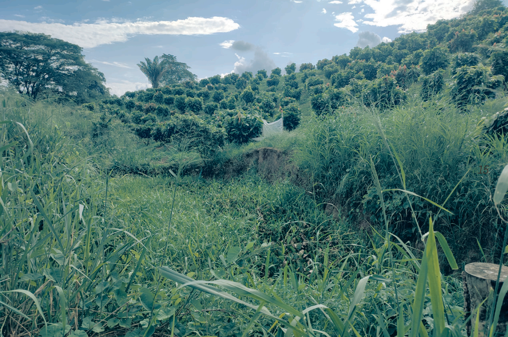
Vista del Humedal en sus veredas y horizonte.

para ser consecuente con el denominado Plan de Nación y Visión de País. La Visión de esta política era la siguiente: