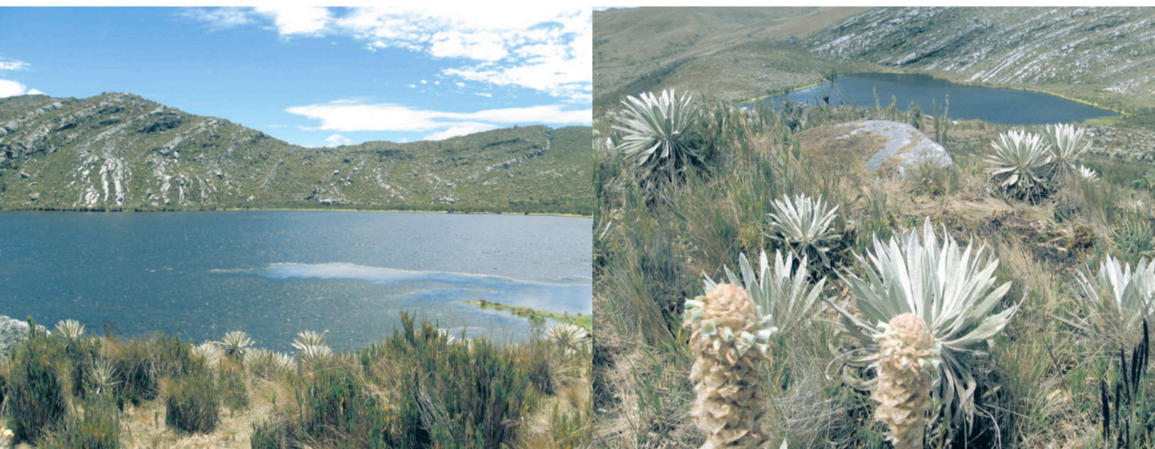
Páramo de Sumapaz.

Los páramos son una eco región o bioma neotropical de gran altitud, ubicados entre el límite superior del bosque altoandino y las nieves perpetuas, entre los 3 mil y 4 mil msnm aproximadamente. Se caracterizan por presentar bajas temperaturas, frecuentes lluvias, neblinas, fuertes vientos y altos niveles de radiación solar. Los páramos se distribuyen a lo largo de los Andes, abarcando países como Perú, Ecuador, Colombia y Venezuela, extendiéndose hasta Panamá y Costa Rica (Hofstede et al. 2014, Vásquez y Buitrago 2011).