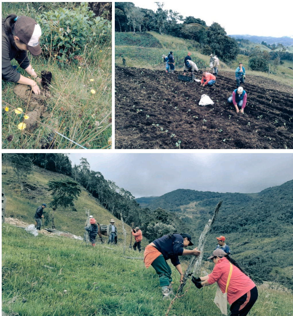
Días de trabajo en el convite campesino, cercando, sembrando y reforestando.

Dentro de la ZRC de Sumapaz existe una propuesta organizativa conocida