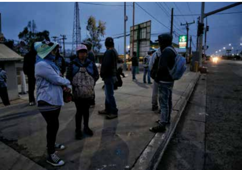
Esperando de madrugada los autobuses que les llevan a los campos de labor.

La mayor parte del tiempo el trabajo lo realizan agachados, no pueden enderezarse unos minutos porque son vigilados por los mayordomos, que le avisan al patrón