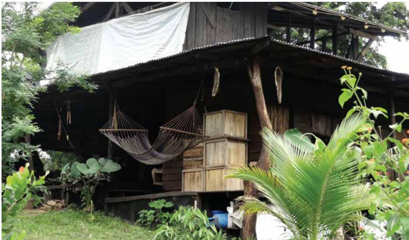
Un espacio agroecológico en la zona Sur-sur de Costa Rica