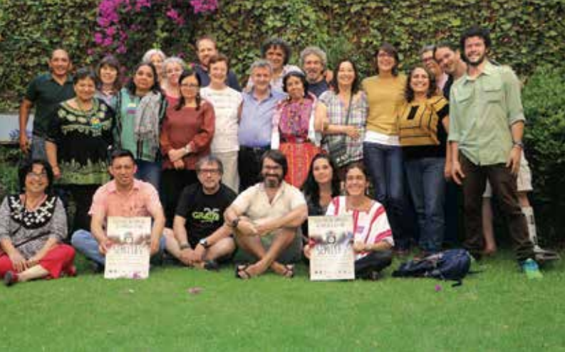
Reunión de la Alianza Biodiversidad y el Colectivo de Semillas de América Latina en México en 2017