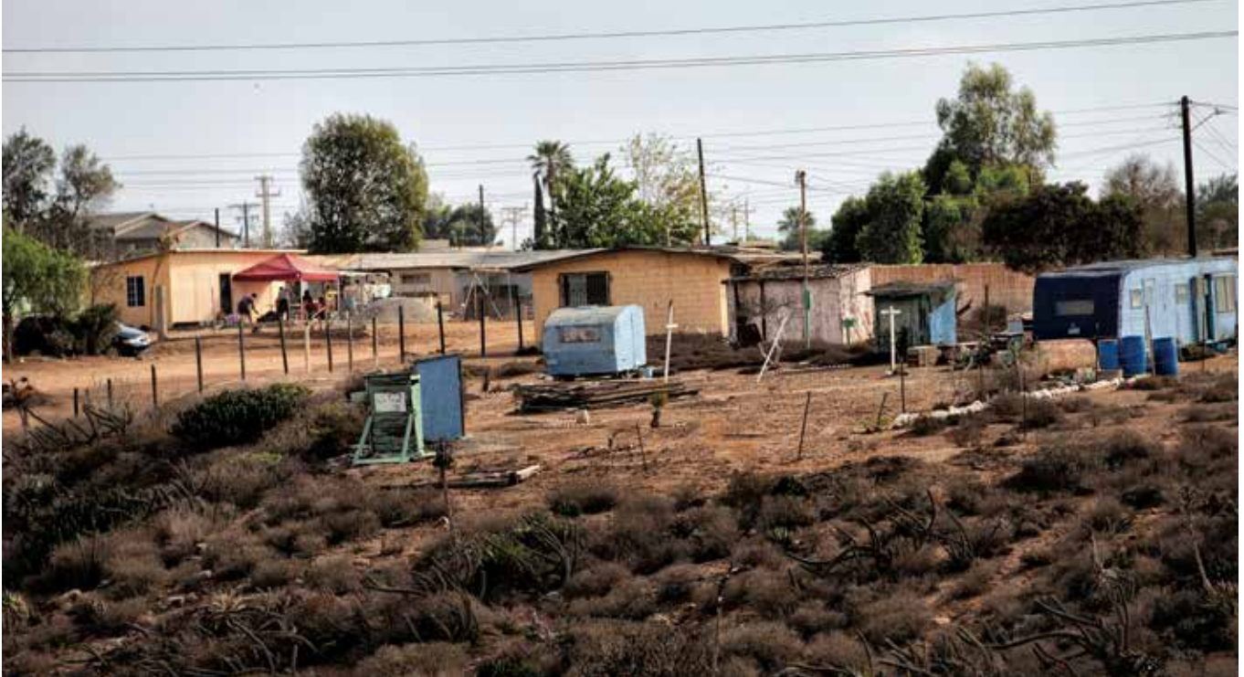
Espacios de vivienda de las jornaleras y jornaleros