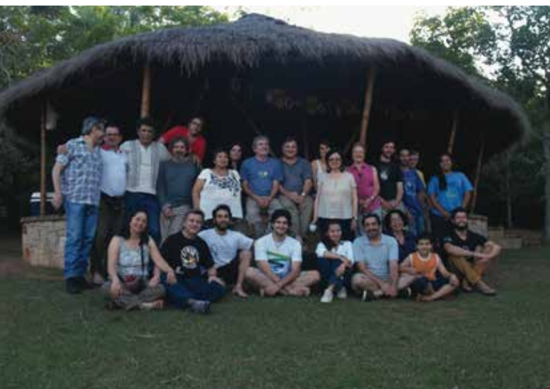
Reunión de la Alianza Biodiversidad en Yvapuruvú, Paraguay, 2015