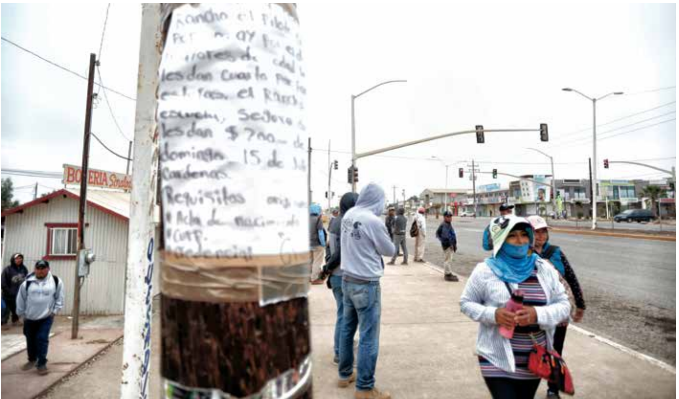
Términos de contratación fijados en los postes

Estado no pueden garantizar protección a los derechos de las personas adultas, mucho menos a quienes sean menores de edad, que deben de trabajar mínimo sus 4 o 6 horas, no pueden trabajar una jornada de más de 12 horas como lo hacen lo adultos. Queremos evidenciar el esfuerzo físico que hacen mujeres embarazadas, adolescentes y niñas que trabajan por necesidad. Nos preocupa la explotación infantil por parte de los familiares, cuan-