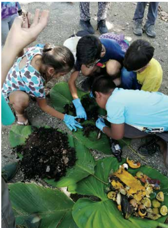
Trabajo con parcelas infantiles.

Esta experiencia colectiva fue fuente de inspiración y abono para nuestras ideas inconformes que no cabían en la burocracia institucional ni en la lógica empresarial que parecían ser nuestro único destino laboral