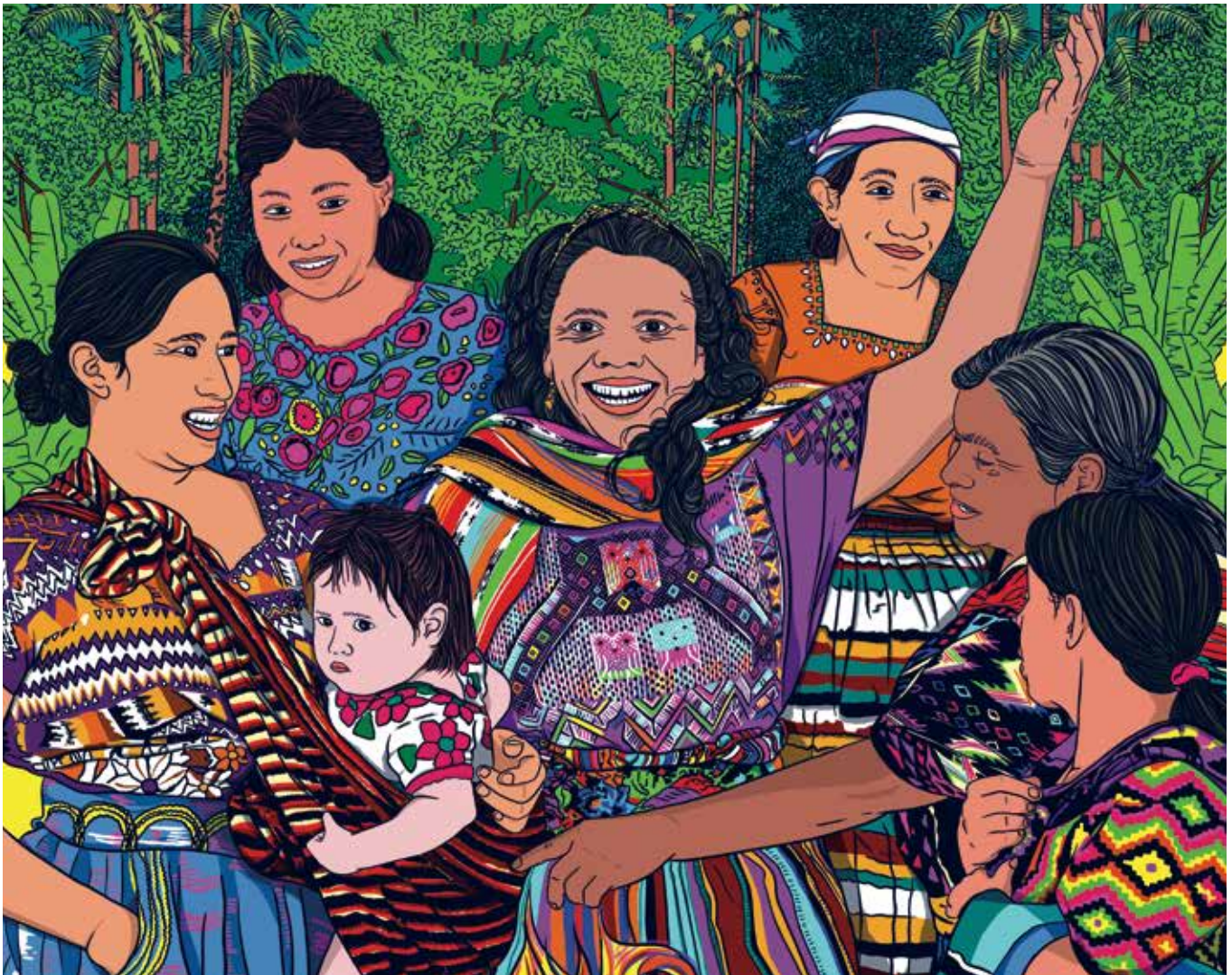
Ilustración: Ximena Astudillo

“Que tu privilegio no nuble tu empatía” fue una de las frases que se leyó en las calles como expresión de las movilizaciones sociales que acompañaron el Paro Nacional que comenzó el 28 de abril de 2021 en Colombia, en contra de la reforma tributaria propuesta por el gobierno de Iván Duque. “Hay un pueblo dispuesto a luchar, y eso me llena de esperanzas”, dijo Francia cuando conversamos con ella ese año, antes de saberse la amplia ventaja que al día de hoy detenta la lista electoral encabezada por Petro.