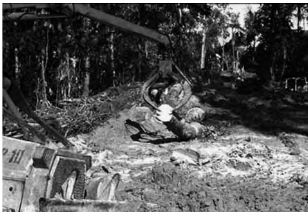
Explotación de Botrosa en Patrimonio Forestal del Estado Bloque 10 Coordenadas 17N 0706760 UTM0064846 (15-10-2002)

dicen los forestales, en forma rolliza. Para poder hacer esto, es necesario que los troncos de los árboles sean extraídos del bosque con la utilización