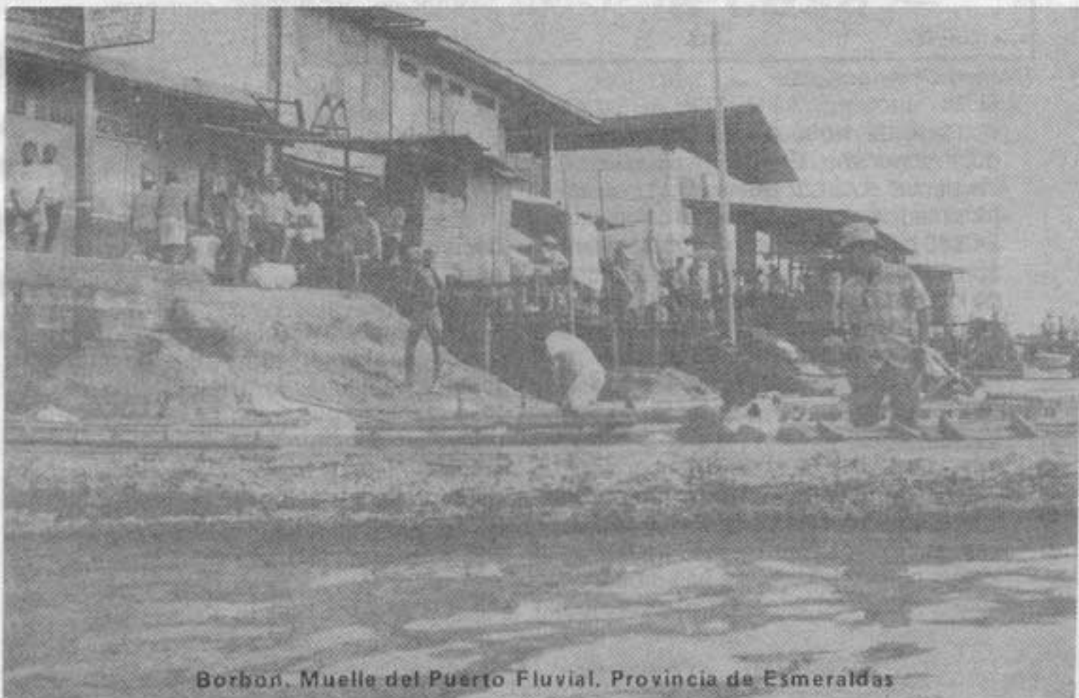
Borbón, Muelle del Puerto Fluvial, Provincia de Esmeraldas