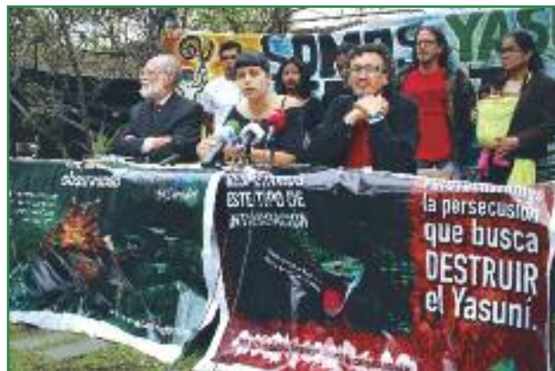
Rueda de prensa para hacer pública la denuncia al Estado ecuatoriano ante la Comisión Interamericana de Derechos Humanos, CIDH (Orlan Cazorla)