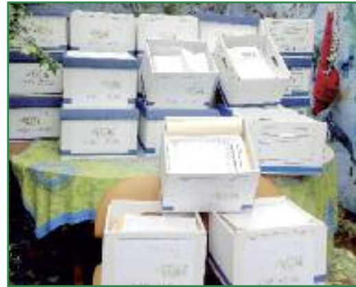
Cajas con las 757.623 firmas conseguidas (Colectivo Yasunidos)