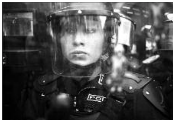
Mujeres policías antidisturbios en las marchas por el Yasuní (Edu León)

En las actuaciones policiales, se ha llevado a cabo la utilización del cuerpo de las mujeres. En las represiones policiales las primeras filas policiales estaban conformadas por mujeres policías, se utiliza por un lado este tipo de estrategia para tratar de visibilizar una supuesta no violencia, que finalmente es ejercida por el cuerpo policial en su conjunto, pero sin embargo se instrumentaliza el cuerpo de la mujer enviando mensajes ambiguos sobre su papel en la represión policial y sobre los roles establecidos.