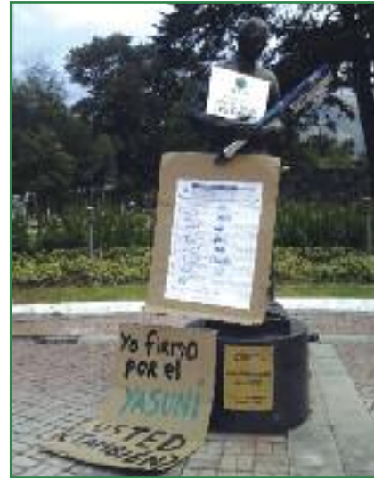
Intervención artística ilustres firman por el Yasuní (Diana Amores)