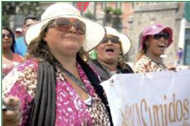
Marcha el día de la entrega de las 757.623 firmas al CNE (Miriam Gartor)