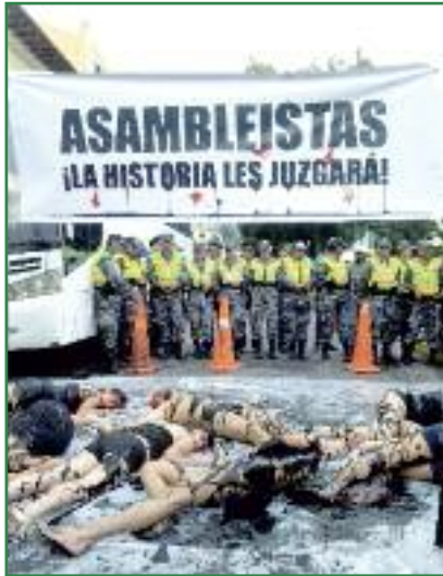
Teatralización etnocidio por derrame petrolero en la Asamblea Nacional (Colectivo Yasunidos)