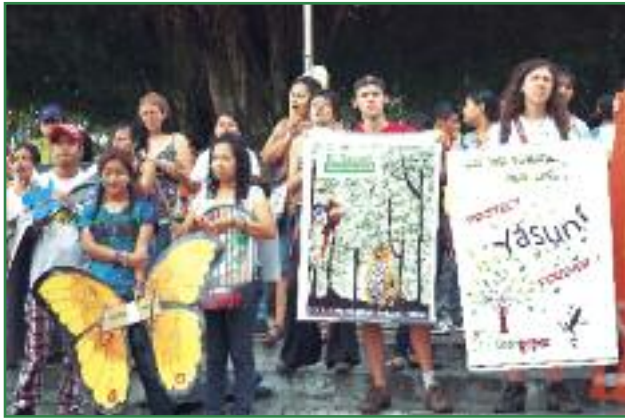
Carnaval por el Yasuní en la ciudad el Coca. Red de Guardianes y Guardianas del Yasuní (Campaña Amazonía por la Vida)