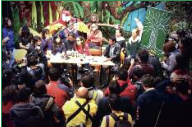
Rueda de prensa donde se anuncia que se dispone de casi todas las firmas (Colectivo Yasunidos)