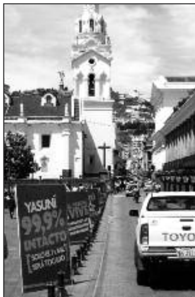
Carteles en la Plaza Grande colocados por el Estado ecuatoriano a favor de la explotación del Yasuní

Desde los primeros días el Gobierno ecuatoriano colocó dispuestos frente al palacio presidencial gigantografías a favor de la iniciativa estatal con posicionamientos oficiales, generando a través de propaganda institucionalista, realizada con recursos públicos, una regulación del espacio público a favor de la posición presidencial. Los paneles se mantuvieron expuestos durante meses.