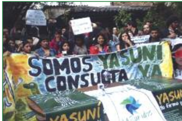
Acción de denuncia con cédulas de identidad para la no desestimación de firmas (Colectivo Yasunidos)