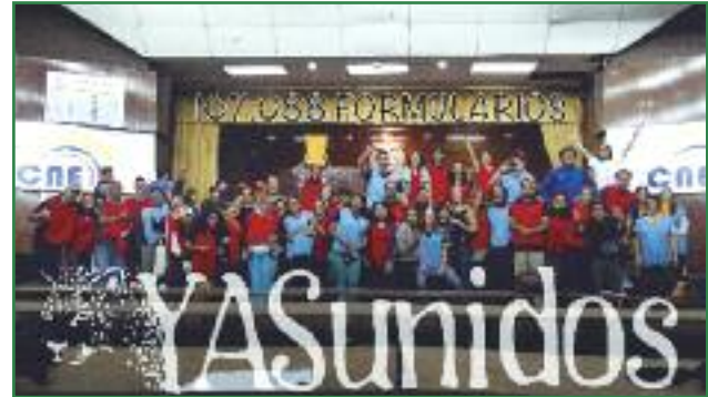
Entrega en el CNE de los 107.088 formularios con las 757.623 firmas (Colectivo Yasunidos)