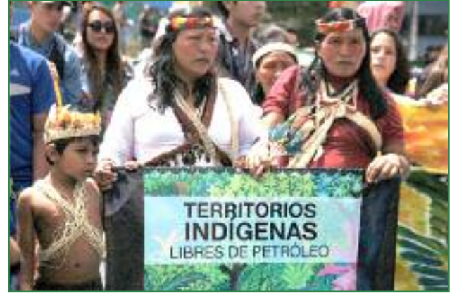
Mujeres amazónicas en la marcha de la entrega de las 757.623 firmas al CNE (Miriam Gartor)