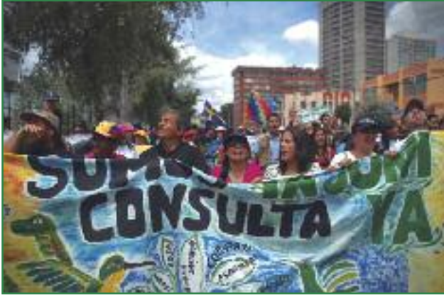
Marcha el día de la entrega de las 757.623 firmas al CNE (Miriam Gartor)