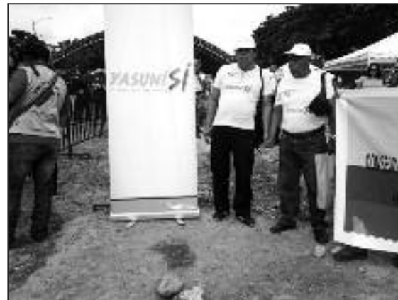
Cartel de recolección de firmas de Yasuní Sí, con el logo del Ministerio del Interior (Colectivo Yasunidos)

Es importante señalar que uno de los eslóganes que utilizó este colectivo en la campaña de recolección de firmas fue Yasuní Sí, y en las gigantografías realizadas para la recolección de firmas a favor de la explotación petrolera se evidencia el logo del Ministerio del Interior al lado del eslogan del colectivo. Lo que hace presuponer que es el propio Ministerio del Interior quien está financiando este tipo de materiales.