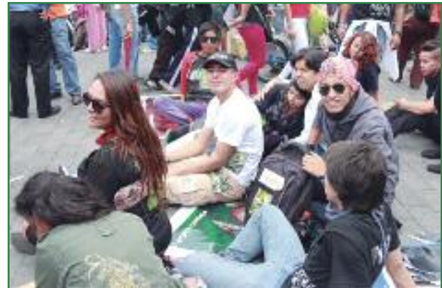
Acciones de protesta en defensa de las firmas (Colectivo Yasunidos)