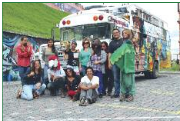
Salida de la caravana climática rumbo a la Cumbre Climática Mundial en Lima (Orlan Cazorla)