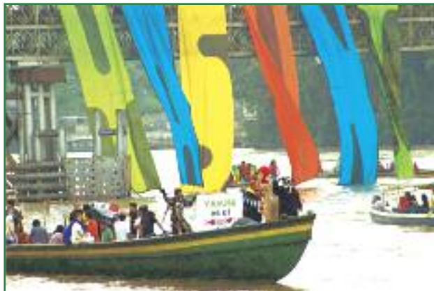
Carnaval por el Yasuní en la ciudad del Coca. Red de Guardianes y Guardianas del Yasuní (Campaña Amazonía por la Vida)