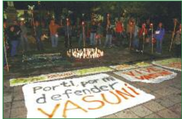
Veladas por el Yasuní en la Plaza Grande (Campaña Amazonía por la Vida)