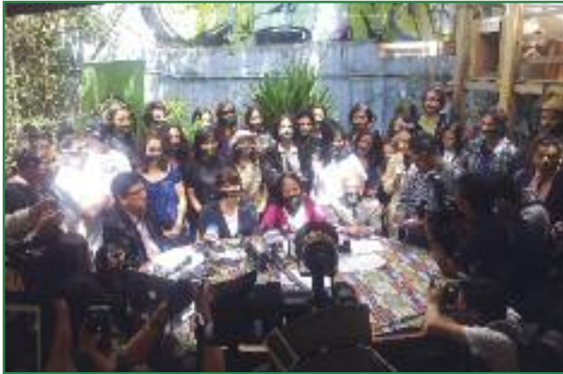
Denunciando en rueda de prensa las primeras irregularidades cometidas en el CNE (Colectivo Yasunidos)