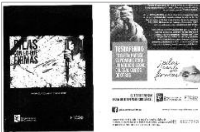
Afiche de la campaña ¡Pilas con lo que firmas! (Superintendencia de Compañías)

Durante el mes de Febrero de 2014 en el que se mantiene silencio mediático respecto al colectivo Yasunidos, se emprende una campaña mediática desde la instancia pública Superintendencia de Compañías, titulada ¡Pilas con lo que firmas!, en la que se alerta a la ciudadanía sobre lo que rubrica porque pueden caer en manos de “testaferros” (El Mercurio, 2014). En el afiche de la campaña indica que se puede incurrir en un delito penado con cárcel. A pesar de que el objeto de la campaña parece ser alertar principalmente en el ámbito de los negocios, resulta sorprendente que dicha campaña se emprenda en la recta final de recolección de firmas del colectivo Yasunidos y en un momento de silencio mediático.