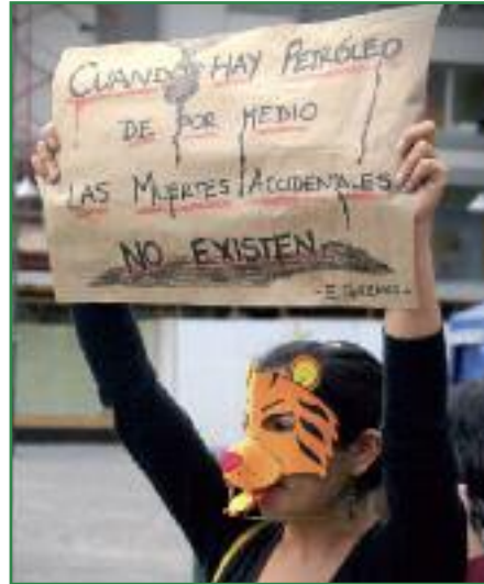
Acciones artísticas contra la declaratoria de interés nacional del Yasuní en la Asamblea Nacional (Miriam Gartor)