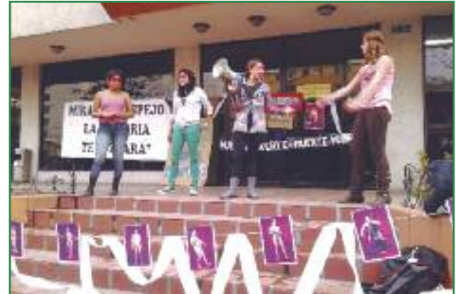
Clausura simbólica del Ministerio de Cultura por no velar por los pueblos en aislamiento voluntario