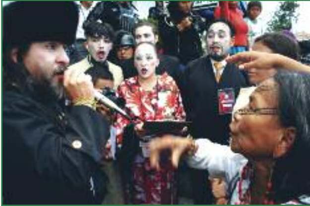
Teatralización "Los chinos y el monopolio petrolero" a propósito de la apertura de la XI ronda petrolera en la Amazonía ecuatoriana (Diana Amores)