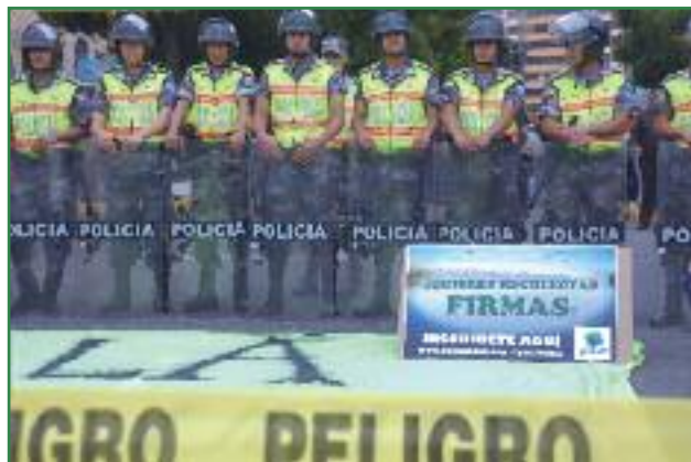
Acciones contra la declaratoria de interés nacional del Yasuní en la Asamblea Nacional (Orlan Cazorla)