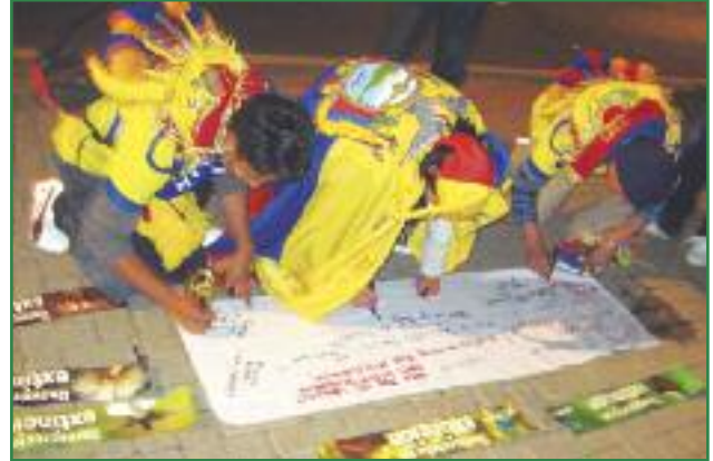
Campaña "Democracia en Extinción" en el Mundial de Brasil 2014 (Colectivo Yasunidos)