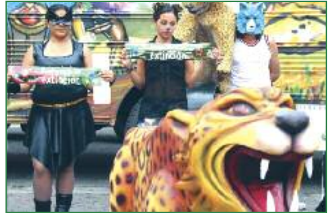
Detención de la caravana climática rumbo a la Cumbre Climática Mundial en Lima (Orlan Cazorla)