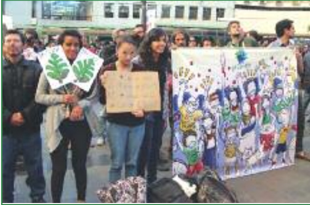
Acciones en defensa de las firmas (Colectivo Yasunidos)