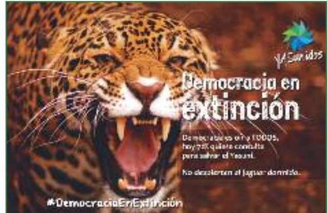
Afiche de la campaña "Democracia en Extinción" por la defensa de las firmas (Colectivo Yasunidos)