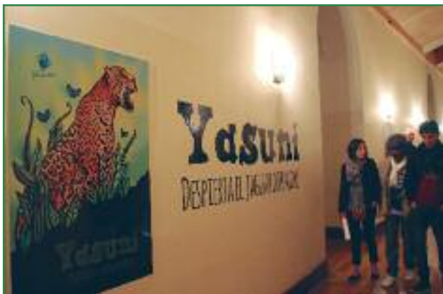
Velada artística por el Yasuní en el Centro de Arte Contemporáneo (Orlan Cazorla)