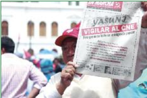
Yasuní, vigilar al CNE para que no se burle de la exigencia popular (Colectivo Yasunidos)