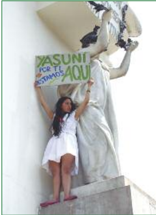
Acción en la Cumbre Climática Mundial en Lima (Orlan Cazorla)