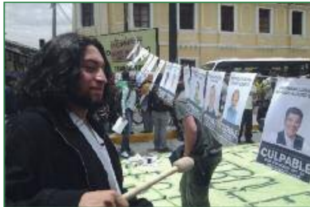
Jornada artística de protesta "Culpables por etnocidio" en las afueras de la Asamblea Nacional (Colectivo Yasunidos)