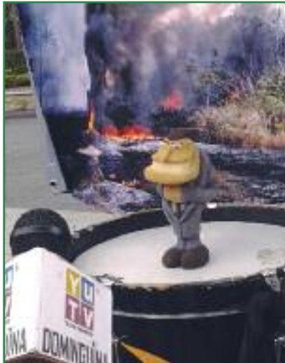
Retransmitiendo "La Dominguina" en Yuka TV, televisión de Yasunidos (Colectivo Yasunidos)