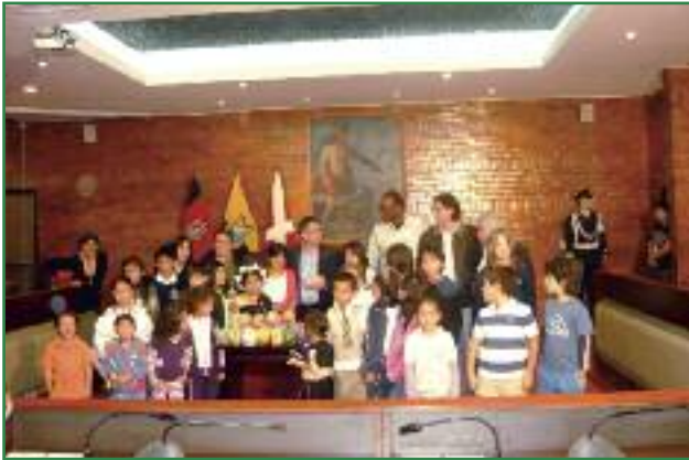
Entrega de chanchitos alcancías por parte de niños y niñas al alcalde de Quito con Vandana Shiva y Nimo Basey (Campaña Amazonía por la Vida)