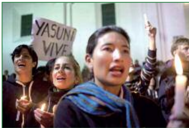
Veladas por el Yasuní el día de la declaración de explotación (Edu León)