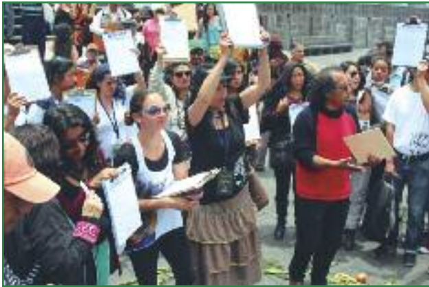
Acción masiva de recogida de firmas por las calles de Quito (Colectivo Yasunidos)