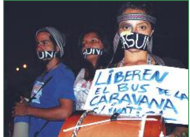
Zapateada por la liberación del bus de la caravana climática (Orlan Cazorla)