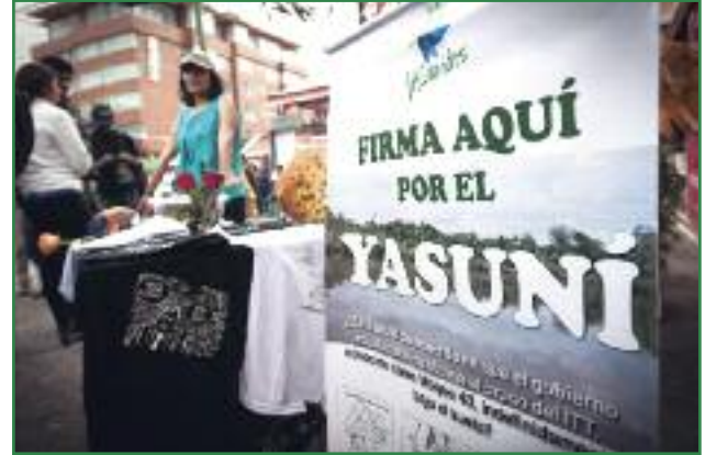
Mesas de recogida de firmas (Colectivo Yasunidos)