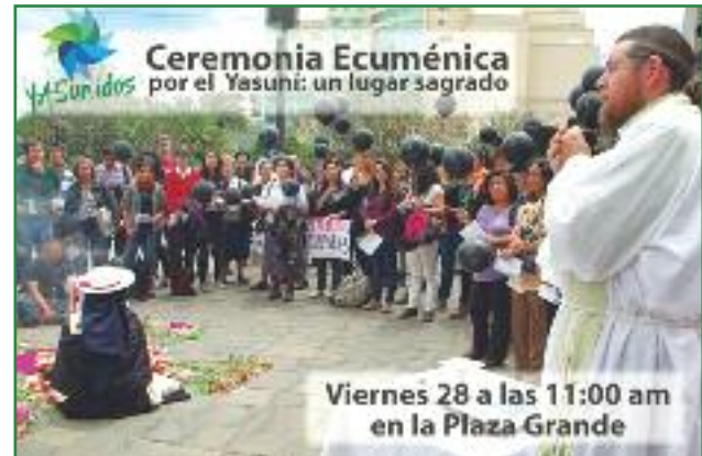
Ceremonia ecuménica para la bendición de las 757.623 firmas (Colectivo Yasunidos)