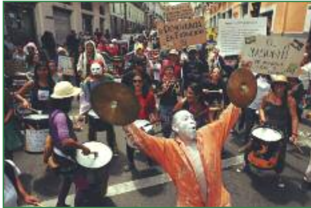
Marcha de protesta el primero de Mayo con la campaña “Democracia en Extinción” (Colectivo Yasunidos)