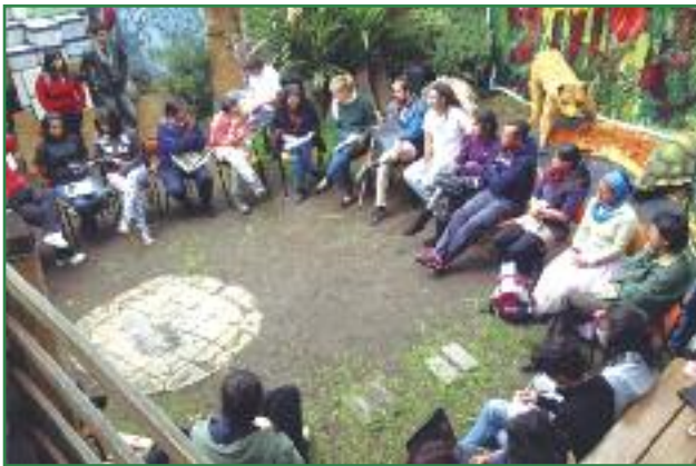
Asamblea del colectivo Yasunidos tras la consecución de las firmas para la consulta popular