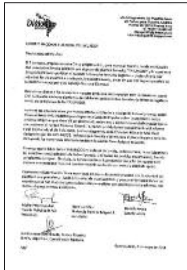
Carta enviada por Adolfo Pérez Esquivel (Nobel de la Paz), Madres de Plaza de Mayo y Serpaj Argentina en apoyo al colectivo Yasunidos

“Hoy les escribimos con el fin de expresar nuestra profunda preocupación -dice la carta- ante la manera que el CNE ha llevado adelante el proceso de validación de firmas”. En la carta, indican que tienen esperanzas de que la voluntad del pueblo prevalezca y aseguran que se mantendrán al tanto del proceso que se siga en el país sobre este tema (Hoy, Adolfo Pérez Esquivel muestra su preocupación por las firmas del Yasuní, 2014).