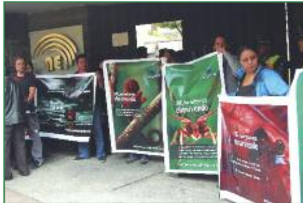
Plantón a las afueras del CNE. "CNE, los estamos observando" (Colectivo Yasunidos)