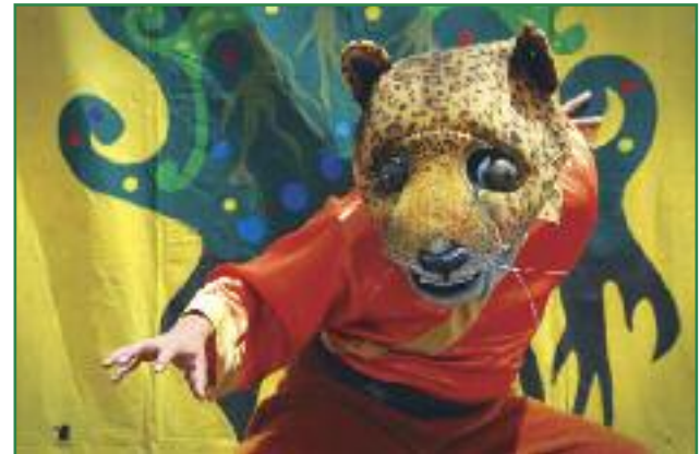
Acciones artísticas en la marcha de la entrega de las 757.623 firmas al CNE (Miriam Gartor)